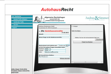
Schritt 4: Anfrage stellen