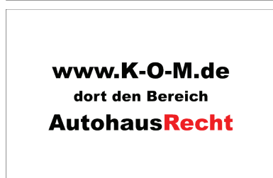
Schritt 1: www.k-o-m.de -> Autohausrecht

ergänzend gelten die AGB unter www.k-o-m.de/autohausrecht