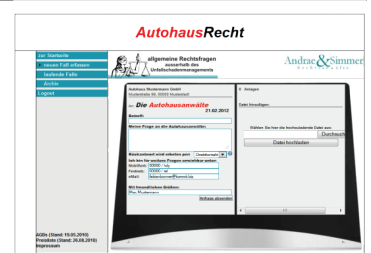
Schritt 4: Anfrage stellen